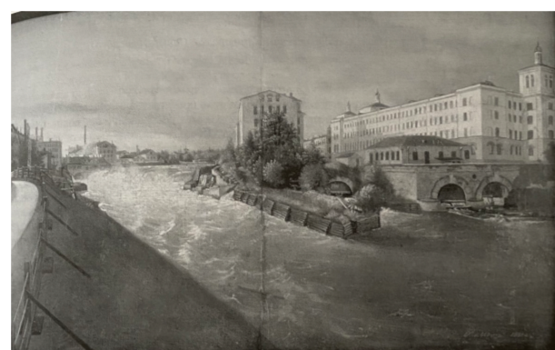
O. VON USING. VAADE KREENHOLMI MANUFAKTUURILE. 1881. ÖLI. NARVA MUUSEUMI KOGUD.

Kreenholmi manufaktuur oli üks suurimaid 19. sajandi tekstiilitööstusettevõtteid nii Vene impeeriumis kui ka kogu Euroopas. Vaatamata sellele, et terve kompleks pandi kinni rohkem kui 10 aastat tagasi ning vabrikud asuvad suletud eraterritooriumil, sai manufaktuurist Narva üks olulisemaid sümboleid, mis avaldab suurt mõju linna kultuurile ka tänapäeval. Uurimise eesmärk on näidata objekti mitmekülgset ning pöörata tähelepanu mittefunktsioneeriva kompleksi kasutusvõimalustele.