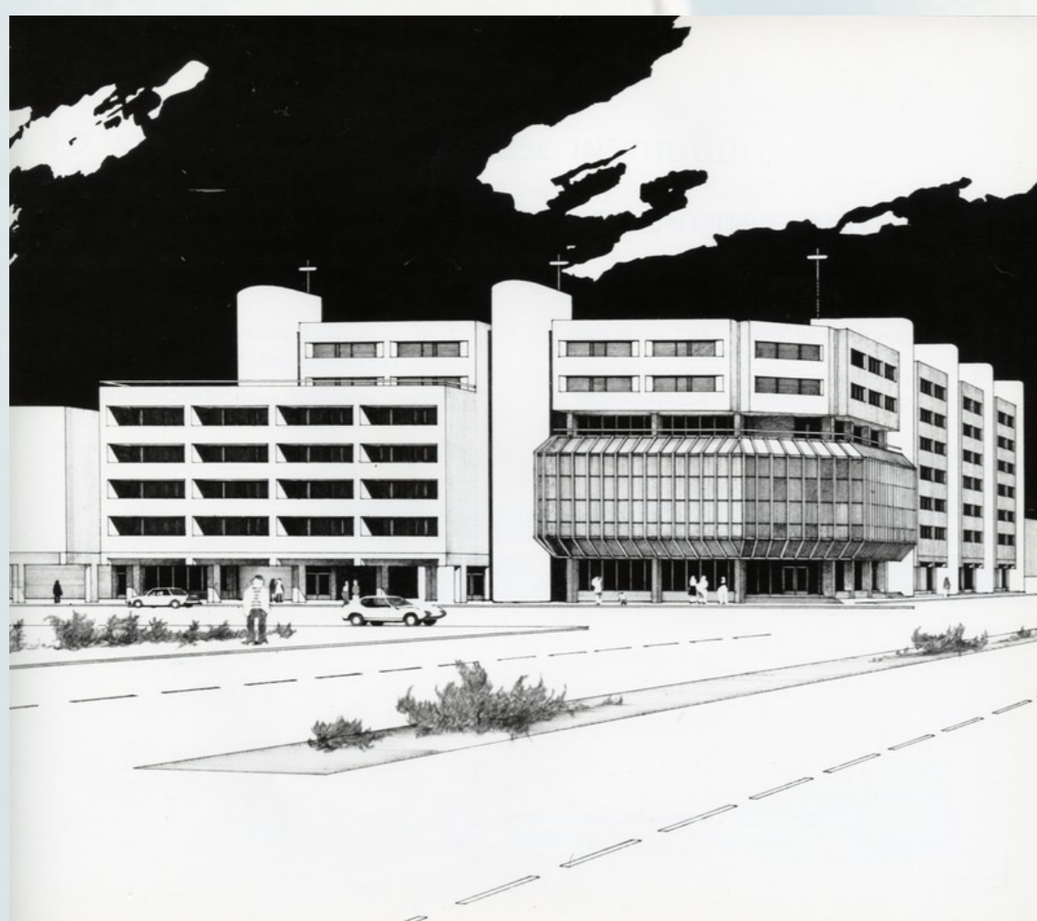
Eesti merelaevanduse korterelamu Narva mnt 31. Miia Masso. Perspektiivvaade, fotorepro.