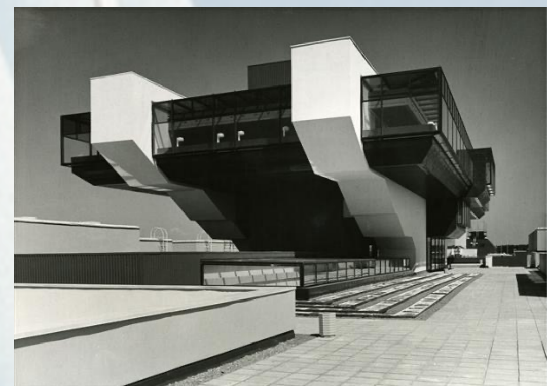
Pirita purjespordikeskuse interklubi