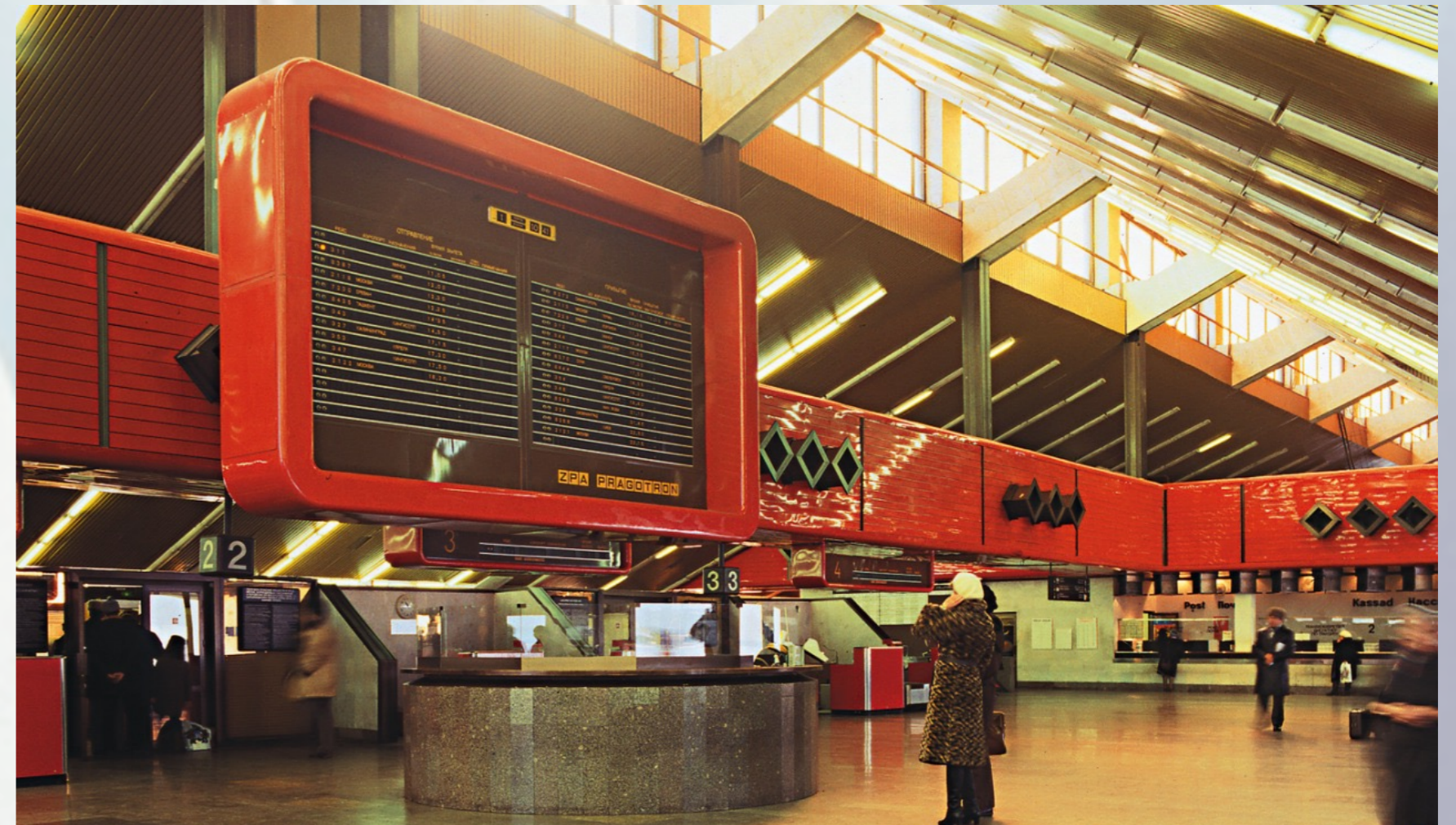
Tallinna lennujaama uus reisiterminal, interjäär. Maile Grünberg.