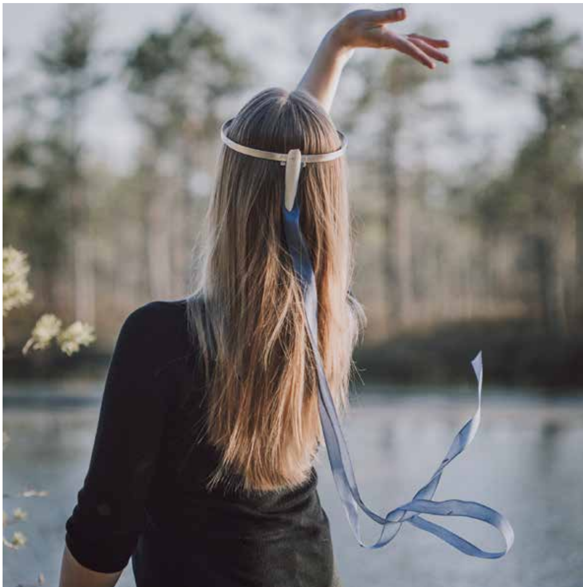
lõputöö /kroon Ilmalind/ juhendaja K. Rannik hõbe 925, luigeluu, tekstiil