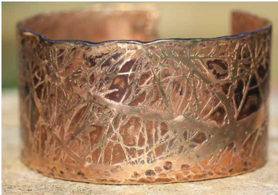
käevõru iseseisev töö vask