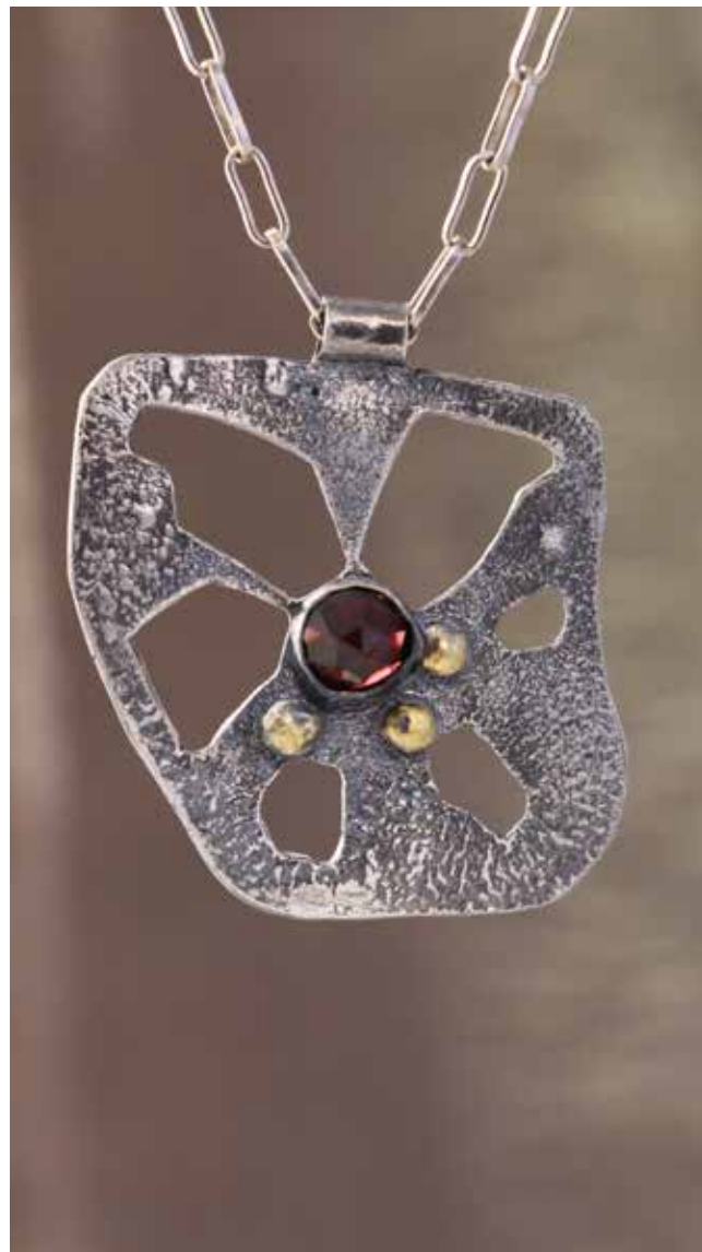
kaelaehe /täht punane/ iseseisev töö hõbe 925, lehtkuld, rubiin