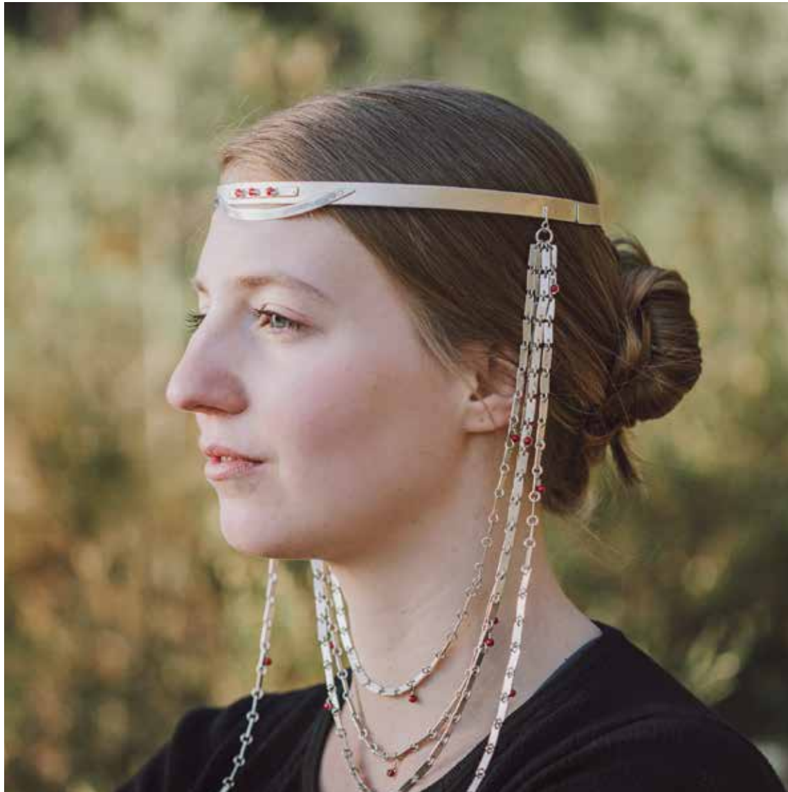
lõputöö /kroon Kolmas kukelaul/ juhendaja K. Rannik hõbe 925, korallpärlid, kuld 585