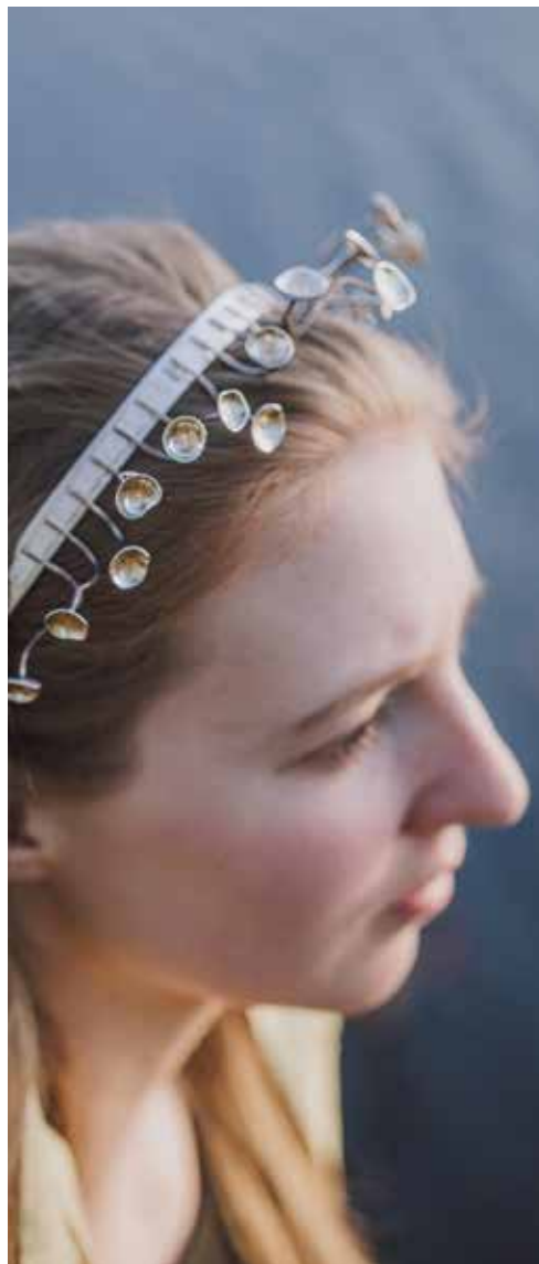
lõputöö /kroon Tulikapärg/ juhendaja K. Rannik hõbe 925, lehtkuld 23,75 karaati