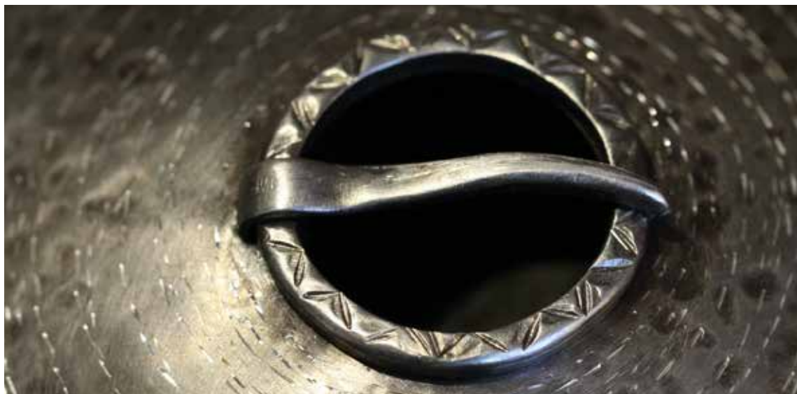
suur sõlg juhendaja E. Riitsaar hõbe 925