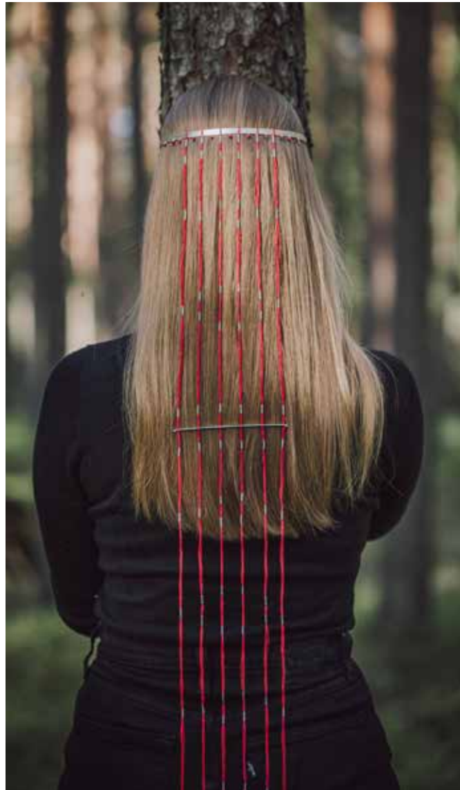
lõputöö /kroon Ussisõnad/ juhendaja K. Rannik hõbe 925, maagelõng, korallpärlid