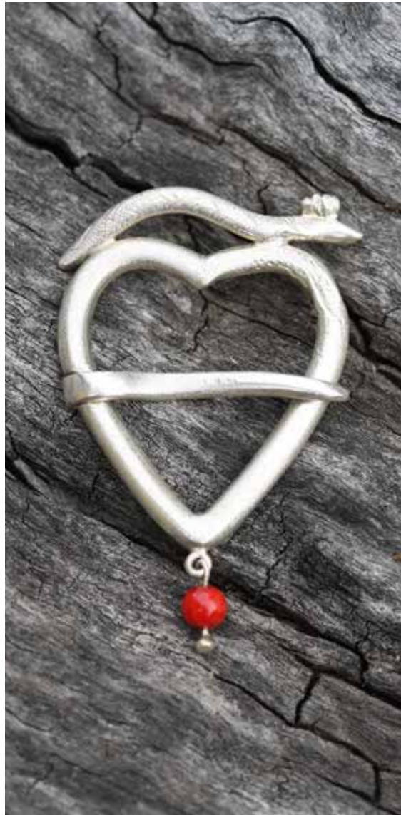
südamega sõlg /ussimaarjapäev/ juhendaja I. Ikkonen hõbetatud vask, korall