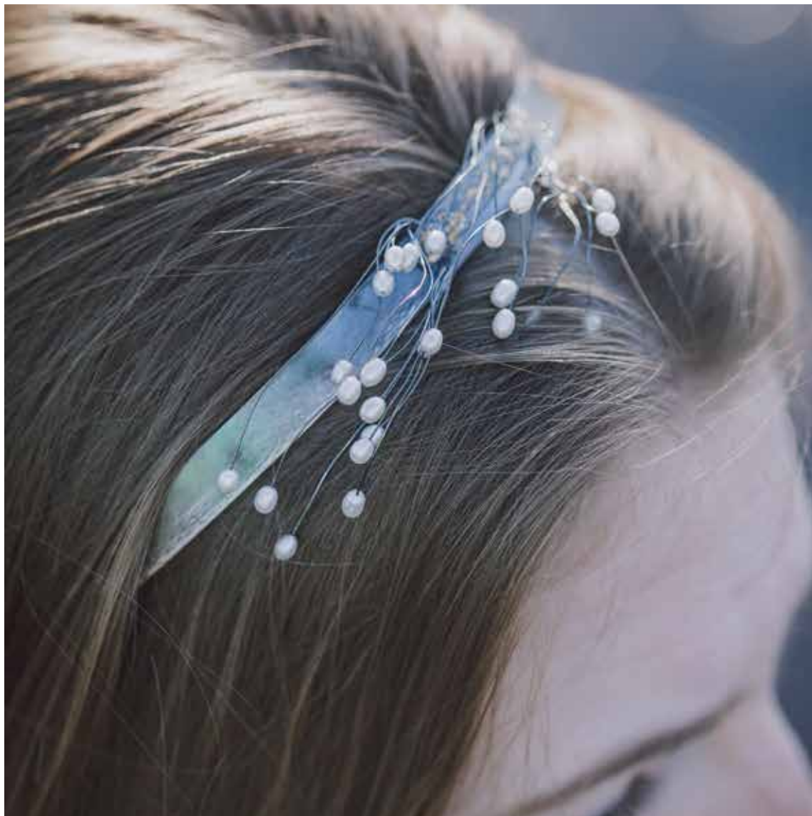
lõputöö /kroon Kuu/ juhendaja K. Rannik hõbe 925, mageveepärlid, lehtkuld 23,75 karaati