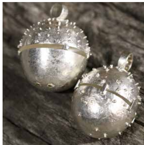
krõll juhendaja H. Varkki hõbe 925