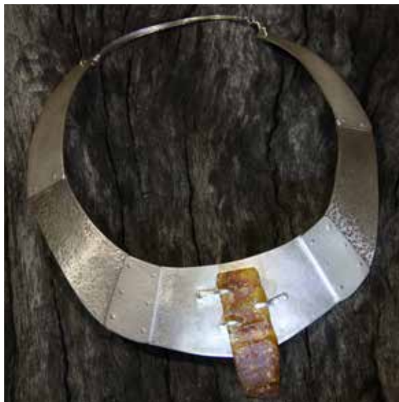
kaelaehe juhendaja E. Edussaar-Harak hõbe 925, merevaik