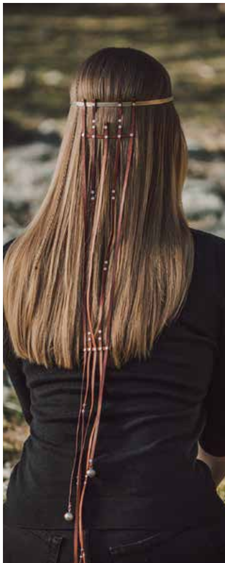
lõputöö /kroon Valjad/ juhendaja K. Rannik hõbe 925, nahk, kuld 585