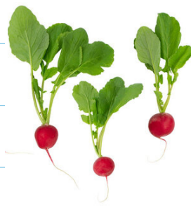
Foto 2. Redis