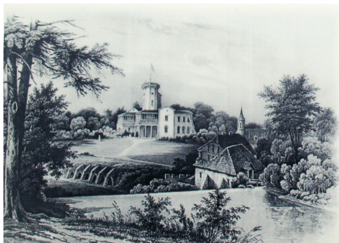
Vaade Keila joalt 1830. a neogooti stiilis rajatud mõisakompleksile ja jõeäärsele vesiveskile

Keila joa kõrval asub Keila-Joa hüdroelektrijaam (varem Keila-Joa mõisa vesiveski). Hüdroelektrijaama võimsus on 365 kW. Vanimad ülestäheldused Keila-Joa vesiveskist pärinevad 1555. aastast, 1928 algas elektritootmine, samal ajal jätkas tegevust ka vilja-veski. Aastal 1936 ehitati uus veevõtukanal ja laiendati kalakasvatuse abihooneid ja 2005 taastas hüdroelektrijaama Eesti Energia. Taastati 20. sajandi algusest pärinev välisilme.