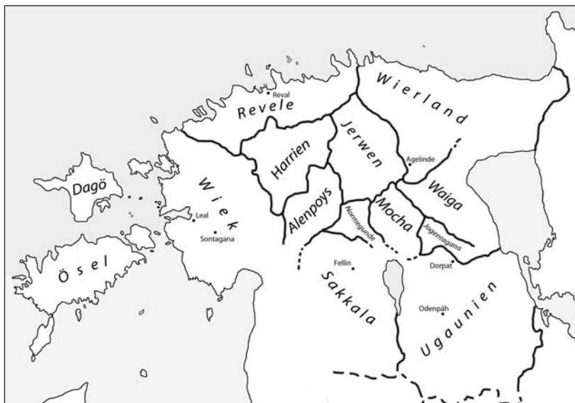
– Abb. 1. Estland um 1220.

sie Anspruch erhob. 13 Auf Bitte des Rigaer Lagers forderte der Papst am 29. Oktober in einem Brief Waldemar II. auf, nichts gegen den Einfall der Kreuzfahrer in Livland zu unternehmen. 14 Da Letztere in der Regel im Frühjahr in Livland ankamen, dürfte diese Ermahnung auf Alberts Befürchtung zurückzuführen sein, dass der König unter Umständen gewillt sein könnte, ihn auf diese Weise unter Druck zu setzen. Im Spätherbst oder Winter 1219 ernannte Albert seinen Bruder Hermann, den Abt des Paulsklosters zu Bremen, zum Bischof von Estland, der somit ein „Gegenbischof“ Wesselins wurde. Als Reaktion darauf untersagte Waldemar den Bürgern von Lübeck, Bischof Hermann und die Kreuzfahrer nach Riga zu befördern. 15