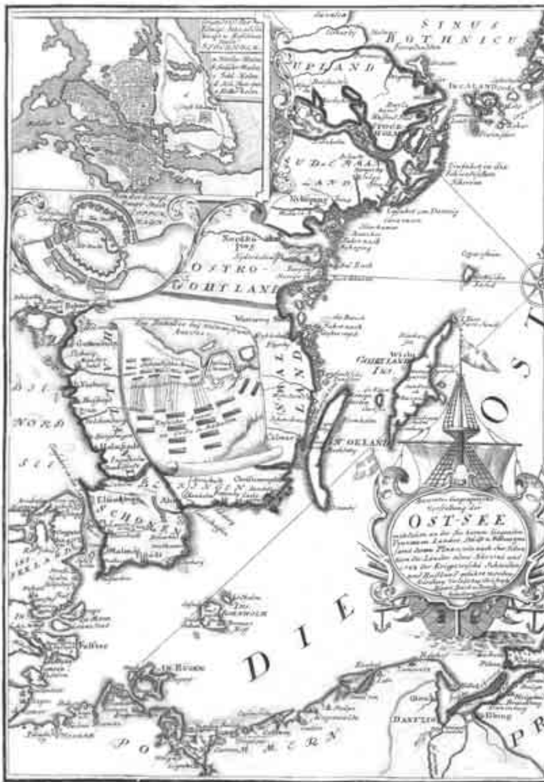
Abb. 1. Accurate geographische Vorstellung der Ost-See mit denen an der See herum liegenden Provinzen, Länder, Städte u. Vestungen samt deren Plans, wie auch der Situation der Länder, alwo Anno 1741 und 1743 der Krieg zwischen Schweden und Rußland geführt worden, Nürnberg [ca. 1743] (Universitätsbibliothek Tartu).