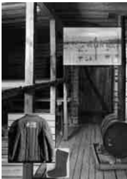
Abb. 3. Planungskizze für den Nachbau einer GULag-Barracke als zentrales Objekt der neuen Dauerausstellung.

1998 wurde erstmals Staatsgästen ein Museumsbesuch angeboten; seither ist das Museum zu einem fast obligatorischen Ort für offizielle Gäste geworden. Königinnen und Könige, Präsidentinnen und Präsidenten, unzählige Minister und Parlamentsdelegationen haben das Museum besichtigt. Der Kaiser Japans dichtete nach seinem Besuch 2007 ein Neujahrs-