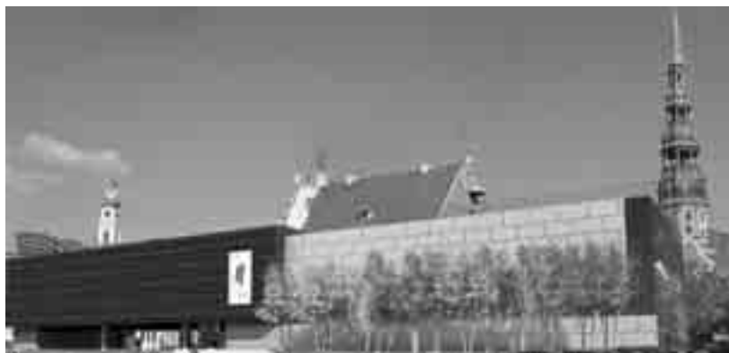
Abb. 1. Projektion des Lettischen Okkupationsmuseums nach der Fertigstellung des Anbaus.

das Museum bis zum heutigen Tag. Die lettische Geschichte zwischen den Jahren 1939 und 1991 wird im Museum unter dem Oberbegriff der „Okkupation“ gefasst, also der Besetzung durch eine fremde Macht. Die verheerenden politischen, ökonomischen, gesellschaftlichen und ökologischen Veränderungen in Lettland während dieser Zeit werden als Folgen der repressiven Okkupationspolitik – sowohl der sowjetischen als auch der nationalsozialistischen deutschen – interpretiert. Die Nichtanerkennungspolitik der Westmächte sowie der bewaffnete und unbewaffnete Widerstand werden als Voraussetzung für die Wiedererneuerung verstanden. Dieser so genannten großen Politik und Geschichte wird die individuelle Geschichte einzelner Personen zugeordnet. Anhand von persönlichen Gegenständen, Gedenkstücken und Dokumenten werden dem Besucher die Schicksale vor Auge geführt. Die Mission des Museums lässt sich mit drei Worten zusammenfassen: erinnern, gedenken, gemahnen.