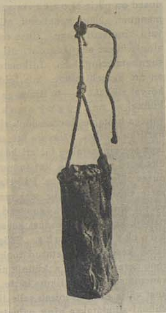
Pilt 7. Kooretorbik, milles štatol alal hoitakse.