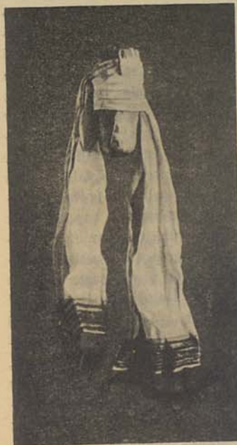
Pilt 6. Mordvalaste püha štatol.

suure küünla südameks harilikku kirikuküünla otsa, millele siis vaha ümber lisandades kasvatatakse ülemalkirjeldatud püha küünal. Mõnikord ei süüdata seda suurt küünalt ennast, vaid selle ser-vade külge asetatakse põlema paar väikest vahaküünalt. Küünal