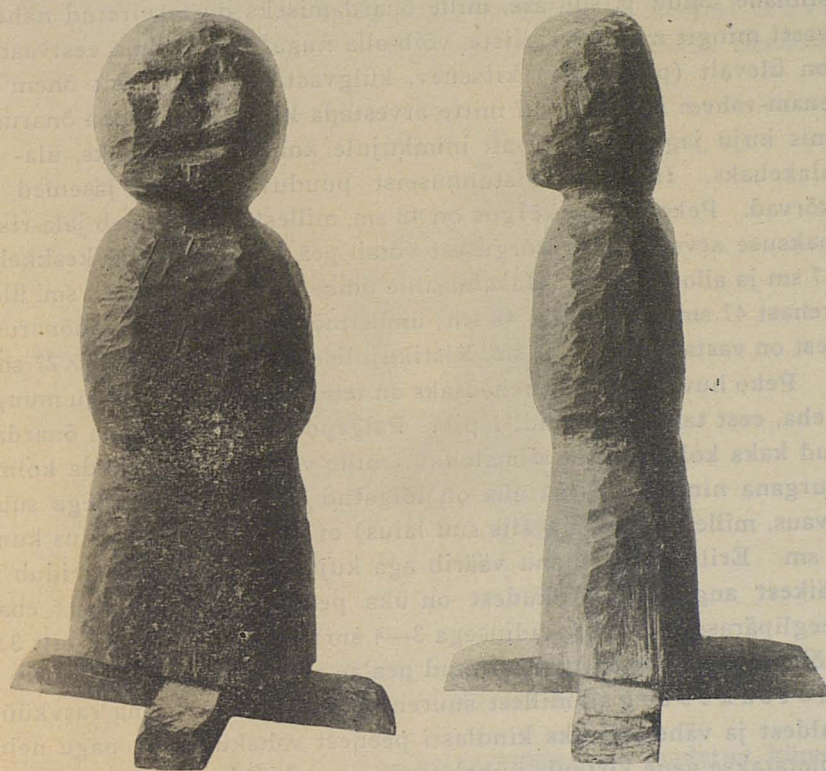
Pilt 1. Peko eestvaates.