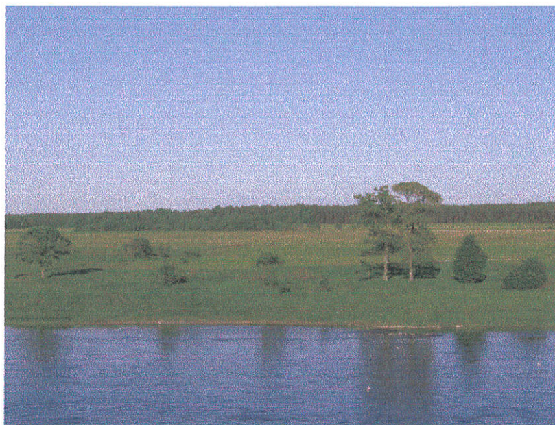
Vaade Venemaale.

kõrgused luited. Ühte sellist piirkonda Permisküla lähedal me külastasimegi. Vaheldumisi samblikurikaste männikutega luidetel tuli laskuda madalatesse märgadesse luitenõgudesse, kus valitsesid turbasamblad. Elamusi jagus nii sambliku- kui samblamaailmas.