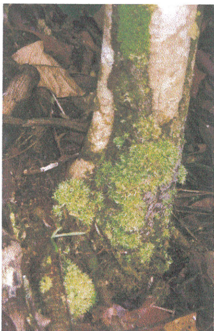
Foto 3. Sammal Octoblepharum albidum Lagunase troopilises vihmametsas.

Palavust oli siin päris raske taluda. Enne metsa minekut kastsin oma heleda pikkade käistega ja kapuutsiga pluusi märjaks ja just kaks-kolm tundi, niikaua, kui see seljas kuivas, oli päris mõnus olla. Käisime koos Unoga, meil mõlematel kulus enamvähem ühepalju aega, et uurida mõnel tüvel või lamapuidul olevaid samblaid või leida mardikaid. Käisin ikka kepiga, koputasin tüvele enne kummardamist, nii nagu Nele oli mulle nõu andnud. Õnneks ei näinud ma kogu reisi jooksul ühtegi madu. Entomoloogidel olid päevad ja ööd tööd täis. Tehti ju ka putukate ööpüüki. Selleks olid kaasas võrgud, lambid ja generaator. Lampide juurde võrkudele kogunenud putukaid tuli öö jooksul mitu korda koguda. Kuna mürgistest putukatest puudust polnud, siis oli parimaks kohaks materjale korrastada moskiitovõrk. Püüdsin pildistada õitsvaid taimi, mis enamasti jäid määramata. Ühel nendest tundis Nele ära liigi perekonnast Costus . Siin