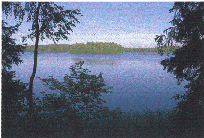
Vaade Pühajärvele, kaugemal paistab üks Pühajärve pärlitest - Kloostriisaar.

sarnane aga ühegagi neist kolmest. Seega tõeline pätkel, mis nõuab pikemat puremist. Väga oluline on ka alles eelmisel aastal Eesti samblanimekirjale lisandunud Dicranodontium demudatum 'i teine leid Kloostriisaare kaldavallilt. PR sammaldest esinesid saartel haruldaste kategooriasse kuuluvad pisitiivik ( Fissidens pusillus ) ja baieri timmia. EPR liikidest Euroopa endeem väike pungsammal ( Bryum subelegans ) ja regionaalselt ohustatud (meil pillatult esinev) kalliklaadium ( Callicladium haldanianum ). Oluline on ka sulgja õhiku ( Neckera pennata ) leid (EPR V, PR 4 ja KK III). Heameel oli näha, et kõikvõimalike kategooriatega kaitstud roheline kaksikhammas ( Dicranum viride ) (EPR V, PR 2, KK II, LoDi II ja B) on koguni kõikide saarte asukas. Pühajärve SKV-sse kuuluvas Mülke soo ja metsa sammaldest olid tähelepanuväärivamad kalliklaadium, väike pungsammal ja kolmis-tahuksammal ( Meesia triquetra ) (PR 4).