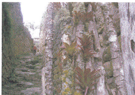
Foto 5. Bromeeliad ja põõsassamblikud Kuelapi kindluslinna sissekäigu müüril. (Foto A. Lindt).

sissekäigu oli loodus väga värvikalt kaunistanud. Siin olid bromeeliate punased rosetid, nende vahel hallid ja oranžid põõsassamblikud (Foto 5). Varemete sees kohtas jälle bromeeliaid, nende punased rosetid kasvasid ridamisi puude võraokstel, samas rippusid pikad hallid habesamblikud ( Usnea sp.). Müürid, tüvealused ja kivid olid sammaldunud. Siin kasvas Andide mägimetsades, põõsastikes, puunadel ja paramodel tavaline sammal Meteorium illecebrum . Chachopoyase piirkond on väga kuulus ka orhideede poolest. Umbes 30000 maailmas teadaolevast orhideeliigist kasvab siinsetes orgudes ja mäenõlvadel 3000 liiki (Miguel & Arguedas, 2003). Nägime neid ka mitmel pool teede ääres õitsemas. Ööbisime orus jõe kaldal, kus kasvas tihedalt bambuseid ja pilliroogu. Veidi kõrgemal oli mäenõlval okaspõõsastik kaktuste ja teiste torkavate põõsastega, kuhu me madude kartuses minna ei julgamud. Kuid ega sealt poleks ka samblaid leidnud.