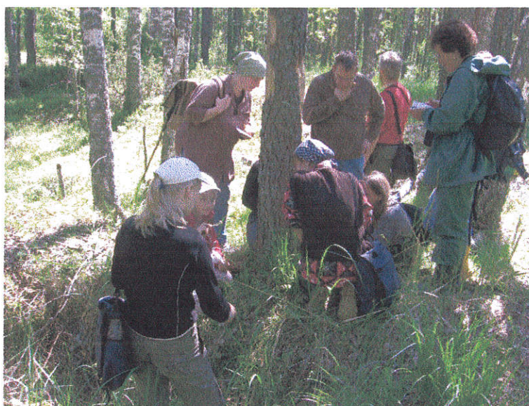
Ave (täpilise rätikuga pildi keskel) asjatundjana õpetab, teised õpivad puutüvedel ettetulevaid samblikke.

populaarne. Peamisteks eesmärkideks lisaks liikide nimekirjade koostamisele olid sammalde ja samblike tundmaõppimine looduses ning aja meeldivalt viitmine. Samblaid ja samblikke võis tundma õppida nii palju kui tähelepanu jätkus või soovi oli, sest asjatundjad jagasid oma teadmisi väga lahkelt. Selline stressivaba õpikeskkond sobib suurepäraselt algajale harrastajale esimeste liikide ja tunnuste õppimiseks või juba õpitu meeldetuletamiseks.