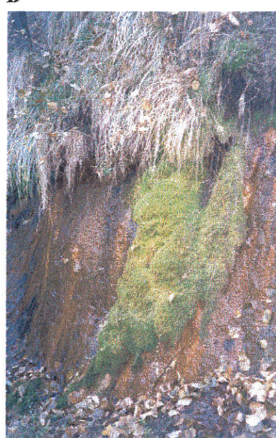
Gauja jõe äärsed liivakivipaljandid Lode ümbruses: Sphagnum quinquefarium 'i (A) ja Palustriella commutata (B) kasvukohad. (Fotod A. Ābolina).

Aastal 1994 publitseeriti esimene Läti sammalde Punane nimestik (Ābolina 1994). Selles on 204 liiki (42% Läti liikide koguarvust), liigid on jaotatud viide kategooriasse. Järgnevalt koostati Lätis kaitstavate samblaliikide nimestik, mis kinnitati 2000. aastal Läti Vabariigi Valtisuse määrusega (Latvias Vēstnesis 2000) ja 2004. aastal määruse parandustega. See nimestik ( toimetaja märkus : lugejale kättesaadav veebiaadressil: