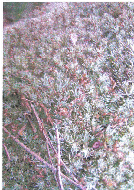
Foto 1. Hariliku valviku kääbusisased emastaimel lehe kõrval (A) ja padjand koos eoskupaaridega (B).

Üksikute liikide puhul on aga avastatud, et söötmel või muudel substraatidel võivad isastaimed kasvada suureks. On selgunud, et emastaimed eritavad ühendeid, mis sunnivad isastaimi jääma kääbusjaks (Glime 2006). Peaaegu iga nähtus looduses teenib mingit otstarvet. Miks on sammaldel kasulik omada kääbusisaseid? Teadupärast vajavad sammaltaimed viljastamiseks tilkvett, mistõttu vahemaa eri sugude puhul ei tohi olla kuigi pikk (keskmine edukas