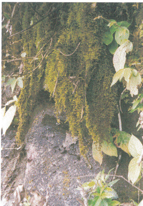
Foto 4. Sammal Squamidium nigricans mägimetsa kaljudel Tarapato lähedal. (Foto L.Kannukene).

oksa. Ühel nendest kasvas suur ja väga dekoratiivne samblik perekonnast Stipa , mille saime samuti näitusele panna. Samblikud määras Taimi Piin-Aaspõllu.