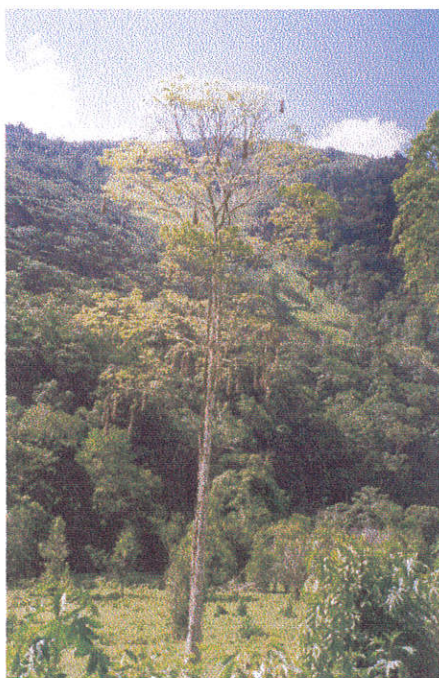
Foto 2. Kangurlindude ( Turupialla ) rippuvad pesad puu võras. (Foto L.Kannukene).

Oxapampast tegime kaks kolmepäevast väljasõitu, ühe nendest piki Oxapampa jõeorgu põhja poole, austria-saksa kogukonna asukohta, Pozuzosse. Läbisime Yanachaga Chemilleni rahvusparki lääneosa, kuhu jäi järskude metsaste kaljude ja arvukate jugadega maaliline Huancabamba kanjon. Teel nägime puid, kus rippusid kangurlinnu ( Turupialla ) pesad (Foto 2). Rahvusparkis elab ka Peruu rahvuslind, peruu kaljukakk ( Rapicola peruviana ), kelle isaslinnud paistavad silma omapäraste punaste kohevate sulgedega poolest pealael.