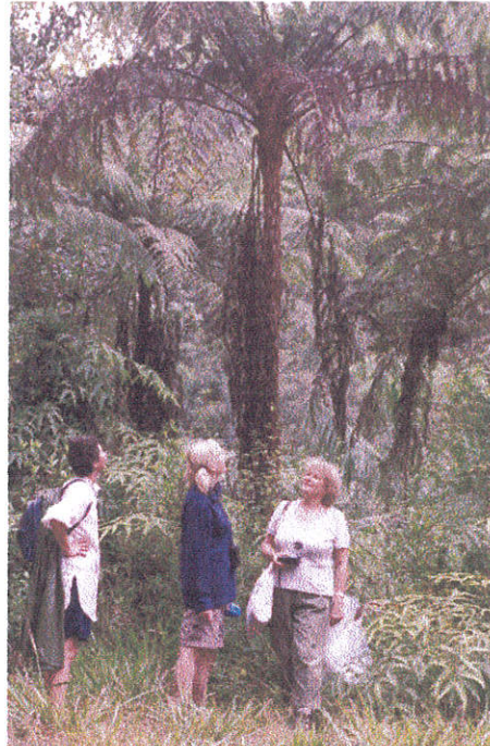
Foto 1. Puusõnajalgade-rikas mägimets Oxapampa lähedal.

Meeldejäävaks oli puusõnajalgade-rikas mets, kus kasvas rikkalikult ka samblaid (Foto 1).