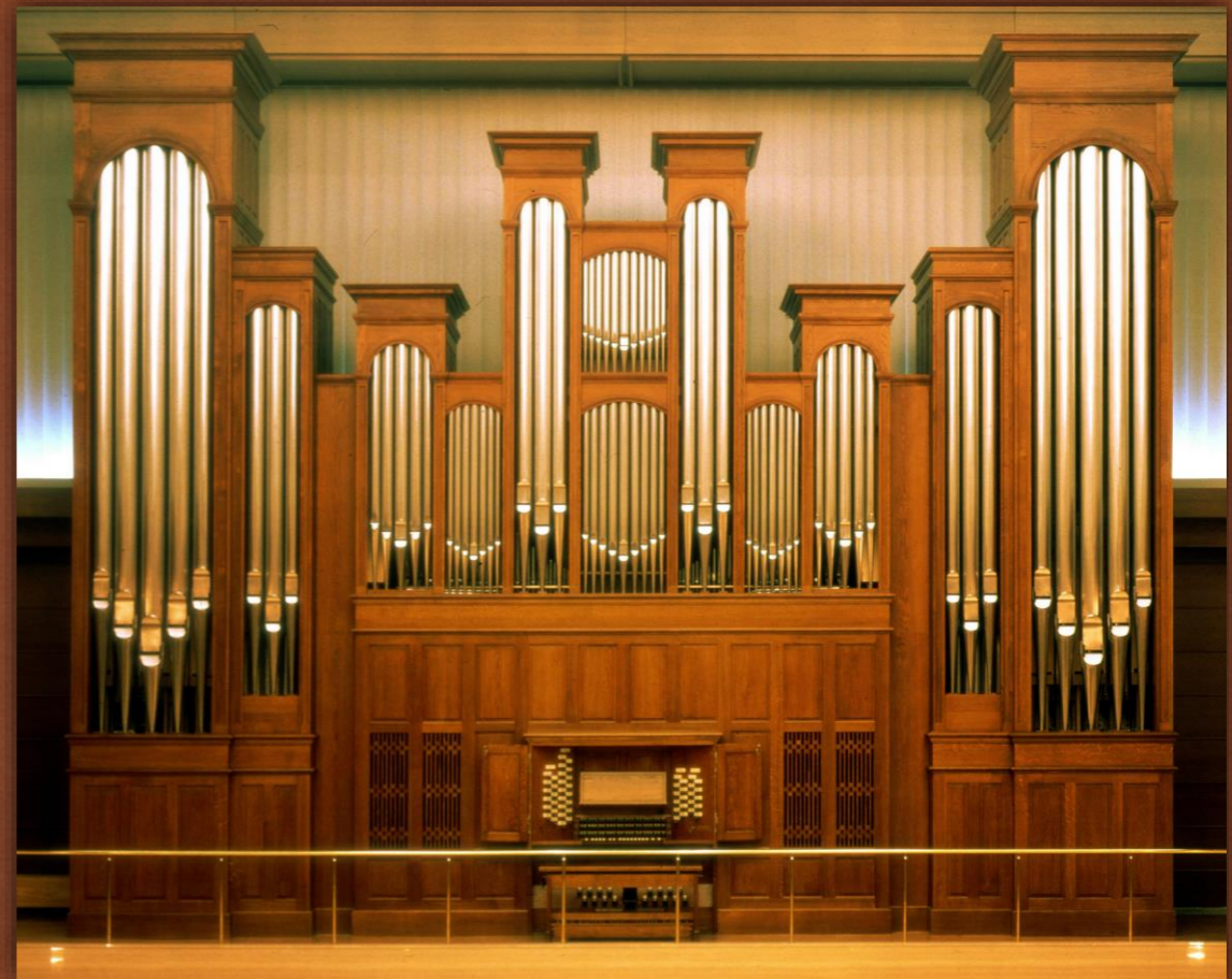
KADRI STEINBACH TÜ VKA