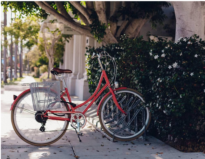
Elamine linnas | Urban living