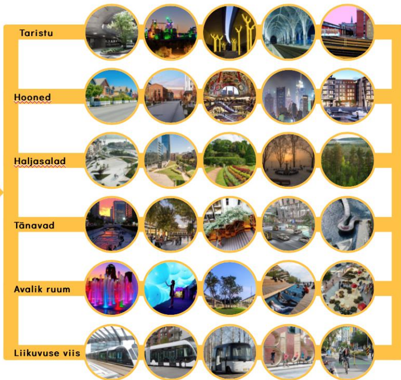
Enim valitud pildid