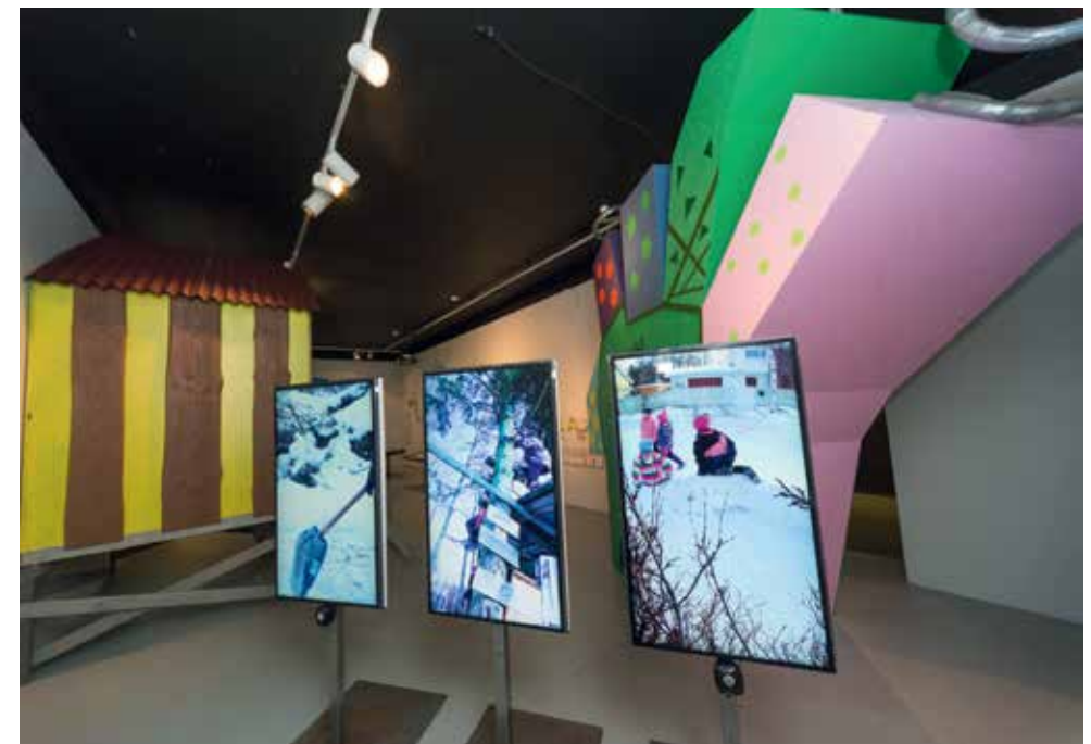
Foto 3. Laste mängu linnas tutvustas näitusel kolm ekraani lühifilmidega, mis näitasid, et lisaks linnatänavatele on laste jaoks olulised mängupaigad ka majadest eemal asuvad haljasalad ja tühermaad.