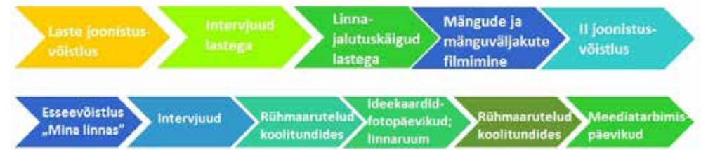
Joonis 1. Esimene (ülemine) uurimisrada tegeles laste linnaruumikujutlustega ja teine (alumine) suund hõlmas eksperimentaalset mitmes asukohas ellu viidud noorteuuringut.

2012.–2014. aastail teostatud uuringu etapid tuli kavandada selliselt, et need oleksid kohandatud Eesti laste ja noorte igapäevaharjumustega. Märkimisväärne osa uuritavatest elas Tallinnas, Tartus ja Pärnus. Projekt käivitus 2012. aasta lõpus essee- ja joonistusvõistlusega „Mina linnas“, kus osalejad kirjeldasid linnaruumi ja -elu häid ja halbu külgi. Võistluse järel siidusid kuraatorid väljavalitud koolidesse põhjalikumale välitööle. Lõpuks kujunes välja kaks uurimisrada: esimene keskendus alla 10-aastastele lastele ja teine 10–16-aastastele murdealistele lastele ja noortele (Joonis 1). Otsuseid uurimuse järgmiste etappide kohta ei langetatud näituse lõppeksponaate silmas pidades, vaid arvestades vajadust saada rohkem teada töö käigus välja joonistuvate teemade kohta. Meetodina kasutati poolstruktureeritud ja struktureerimata personaalseid ja rühmaintervjuusid ning eksperimentaalseid osalevaid tegevusi, mis põhinesid laste eeldatavatel oskustel, nagu joonistamine või lugude jutustamine ja kirjutamine, mille abil neil oli võimalik näidata nende jaoks olulisi kohti ja kirjeldada igapäevategevusi linnas.