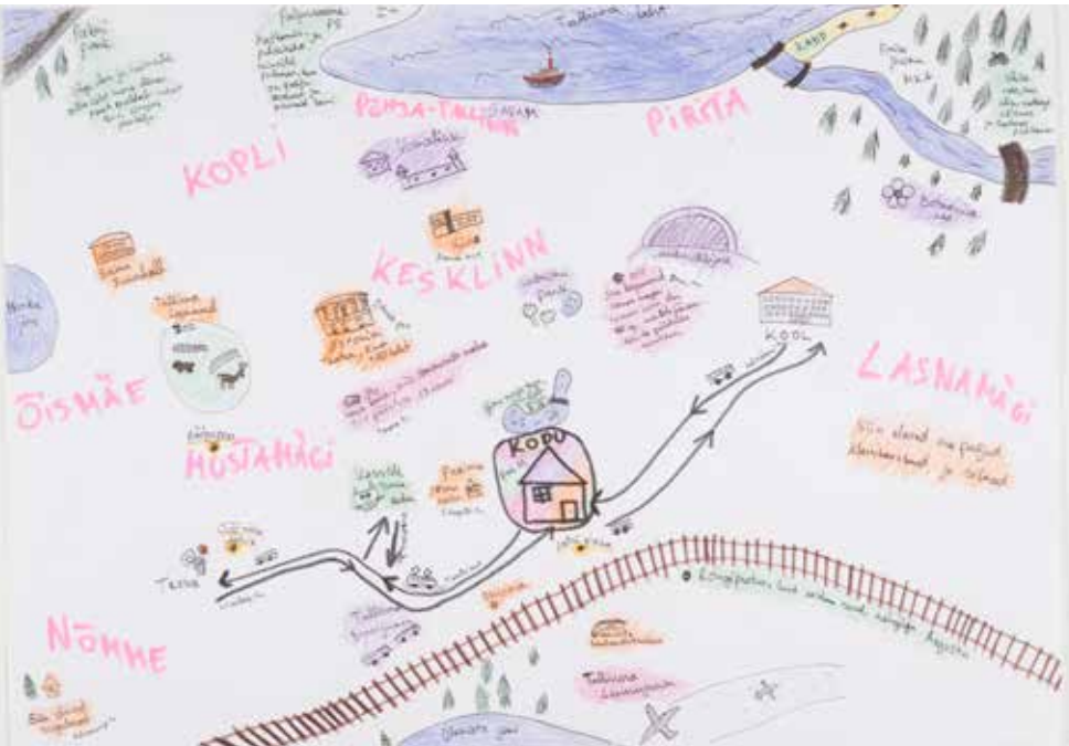
Foto 4. Näituse ettevalmistustöö käigus kaardistasid noored oma personaalseid linnatrajektore ja neile olulisi kohti linnas.

Kui hakkasime kogutud materjali põhjal välja valima ja arendama tegelikke näituseeksponaate, sarnanes otsustusprotsess pigem etnograafilise uurimistööga, mille käigus lisasime näituse kui tõlgendava ruumi loomiseks peamiselt tõlgenduslikku ja analüütilist mõõdet. Me ei püüdnud eksponaatide valimise kaudu luua sidusat narratiivi, eesmärgiks oli avatud näitusekeskkond, kus külastajad saaksid ise eksponaatide vahel tähenduslikke seoseid luua.