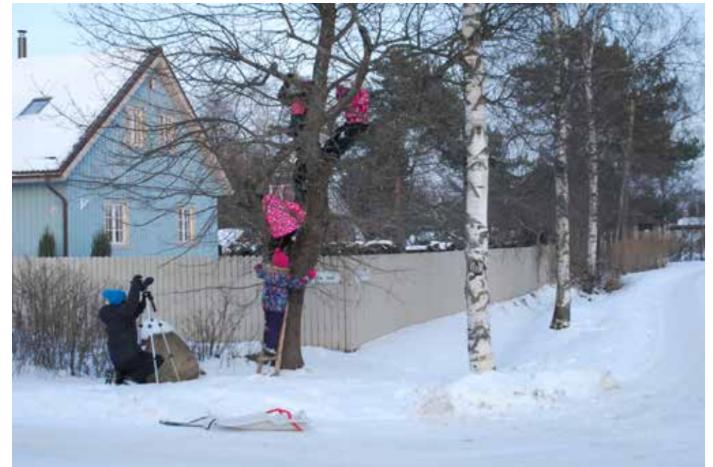
Foto 2. Laste mängupaikadega tutvumiseks käisid kuraatorid lastega linnas jalutuskäikudel, kus filmiti ka nende mängu.

Järgisime kogu protsessis seda lähenemist, et noorte ja laste uurimise asemel uuritakse koos nendega. Otsus pöörduda näituseprojekti peamiste allikatena laste