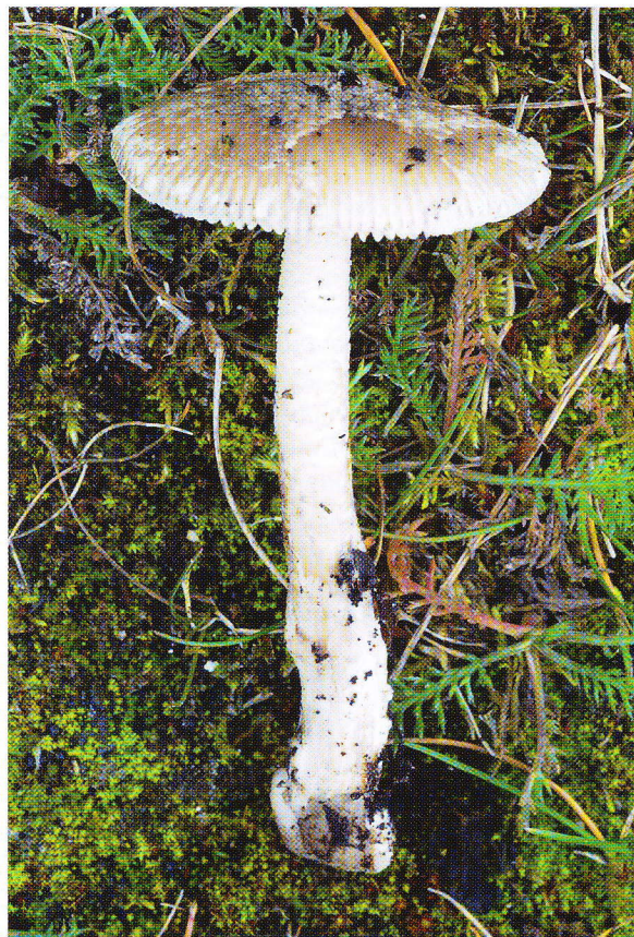
FOTOD: JA JOONISED: VELLO LIIV

Mürgisuse kahtlusega. Eesti punases raamatus.