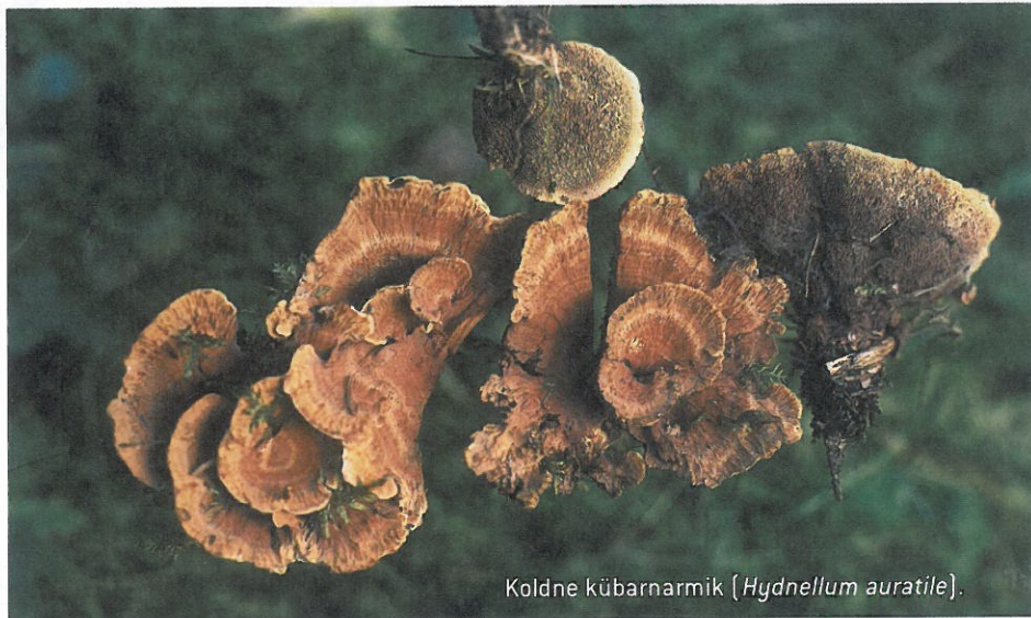
Koldne kübarnarmik ( Hydnellum auratile ).

Meil on vähemalt seitse kahvatu- või tumepruunide narmastega kübarnarmikut, mis kõik kasvavad metsades. Nende enamasti vöödilised kübarad on sageli lausa vastu maad. Kübar aheneb allapoole lühikeseks jalaks, enamasti on paar või hulk kübaraid üksteisega servipidi kokku kasvanud. Läbilõikes on seen tsooniline, sageli pruunide või sinakate vöötidega. Siiani Eestist leitud liigid on tõenäoliselt seotud ainult või peamiselt okaspuudega, millega moodustavad mõlemale