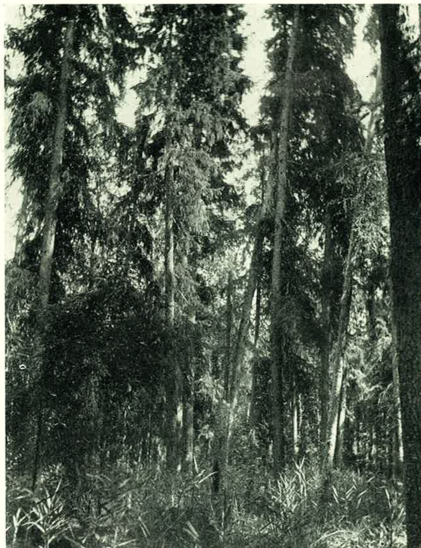
16. joon. Näide puistust looduskaitse reservaadil Kastre-Peravallas, kv. 106. Esiplaanil umbes 200-aastased kuused. — A part of section 106 in Kastre-Peravalla Protected Area. In the foreground firs about 200 years old.

Cinna latifolia Griseb. — kv. 106 (18. VIII 1931, ka G. Vilbaste, 1929, p. 21); kv. 130, 131, 143, 144, 196 (27. IX 1931); kv. 34, 38, 40 (27. VII 1933); kv. 45, 56, 57, 58, 71, 77 (23. VII 1935); kv. 15 (4. VIII 1935). Selle taime levik viimasel aastakümnel on Kastre-Peravalla õppemetskonnas tunduvalt laienenud, esinedes viimastel aastatel kohati massiliselt. Raiesmikkudel ja noortes kultuurides on see taim muutunud isegi tülikaks metsaumbrohuks. Selle leviku laienemise põhjuseks näib olevat kliima kuivenemine, mistõttu paljud vesised alad on kuivenenud ning põhjavesi tunduvalt langenud.