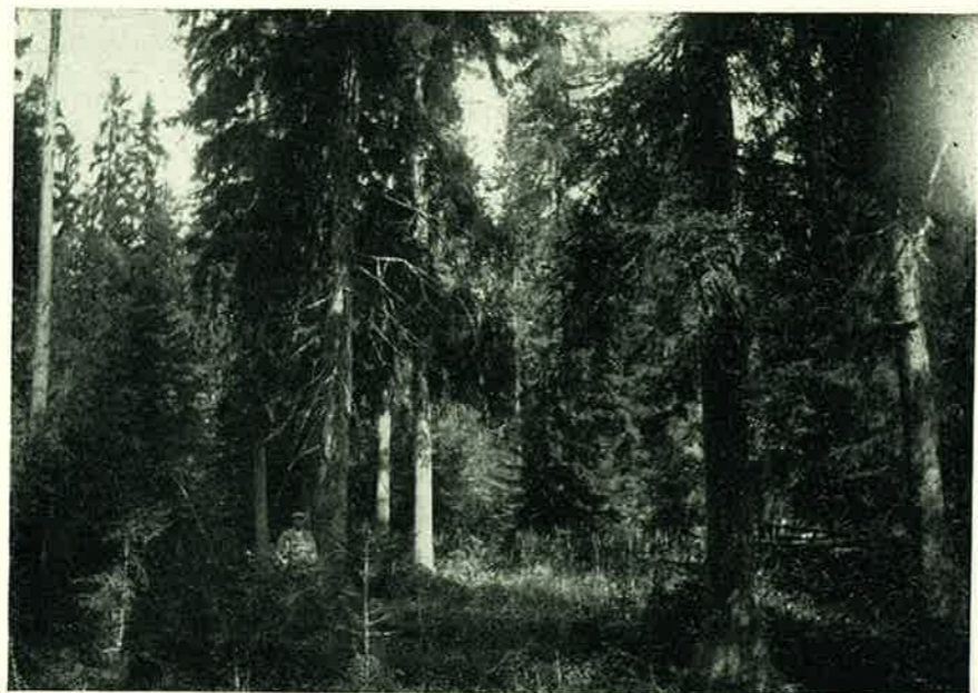
Ürgmets Tartu Ülikooli õppe- ja katsemetskonnas. Esiplaanil vanad kuused. — A virgin forest in a Tartu University Instructional and Experimental forest. In the foreground old firs.