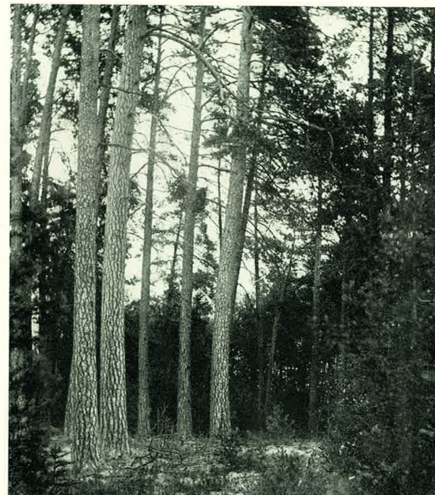
Ürgmets Kastre-Peravallas Tartu ülikooli õppe- ja katsemetskonnas. Esiplaanil umbes 200-aastased männid. — A virgin forest in a Tartu University Instructional and Experimental forest at Kastre-Peravalla. In the foreground old pines about 200 years old.