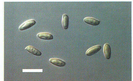
Harilikku kivipuraviku, kasepuraviku ja lehmatatiku eosed. Skaala 10 mikromeetrit.