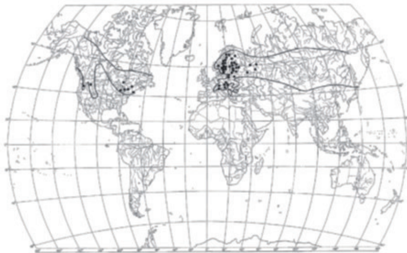
② Limatünniku levik maailmas (Nitare 2009)

Limatünnik kasvab vähese alustaimestikuga keskealistes ja vanades kuusikutes ning kuuse-segametsades, sageli veekogu lähedal happelistel niisketel liivakatel muldadel [6]. Rohtunud metsades leidub teda pigem harva. Sada aastat tagasi arvati, et limatünnik elab mükoriisaseenena sümbioosis kuusejuurtega [8, 15]. See ei ole õige, sest laboris kasvab ta puhaskultuuris tehissöötmel. Seetõttu on tegemist saprot-