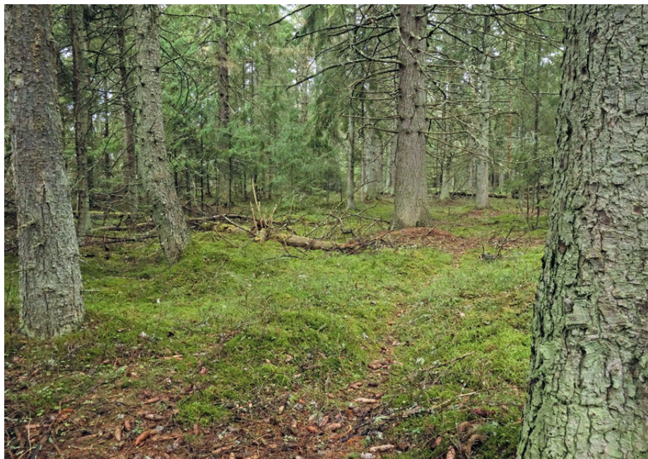
④ Kasvukohana eelistab limatünnik hämaraid kuusemetsi

ris ning seda on juhtunud hiljemgi. Viljakehade arvu suurenemist viimase paari aastakümne soojadel talvedel on ka lähiriikide mükoloogid seostanud kliimamuutustega [7].