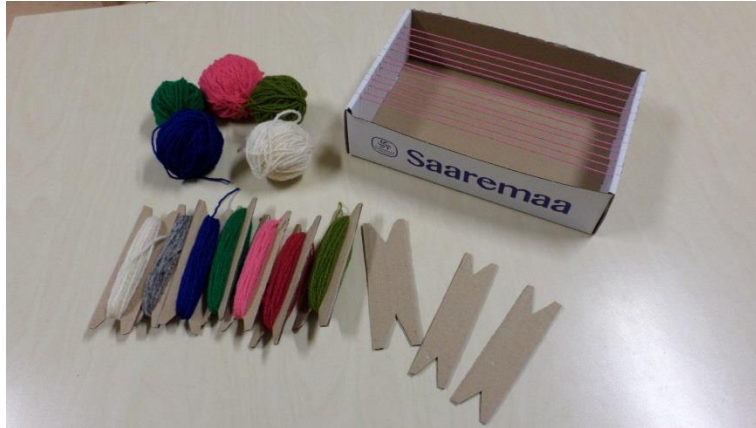
Karp lõimega ja lõngad (2017, E.Tammoja)