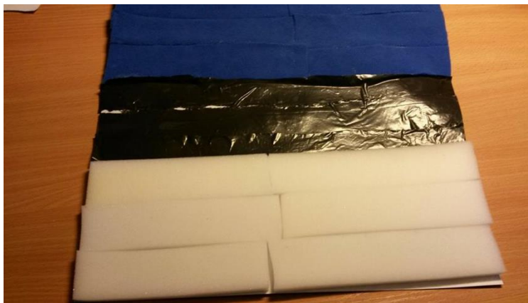
Valmis töö, noorem rühm (2017, L.Leitsmann)