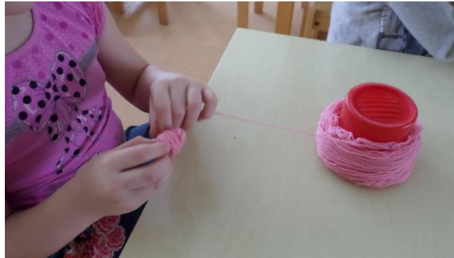
Lõnga kerimine üksi (2017, E.Tammoja)