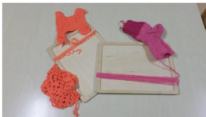
Vanade asjade harutamine (2017, E.Tammoja)