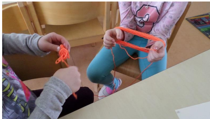
Lõnga kerimine kahekesi (2017, E.Tammoja)