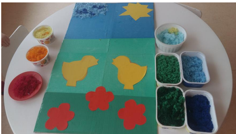
Erinevat värvi lõngatükid ja aluspilt (2017, H. Valdmann)