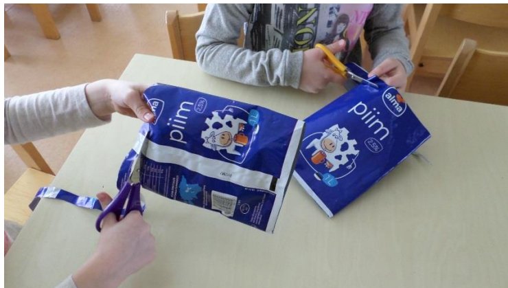
Kile lõikamine (2017, E.Tammoja)