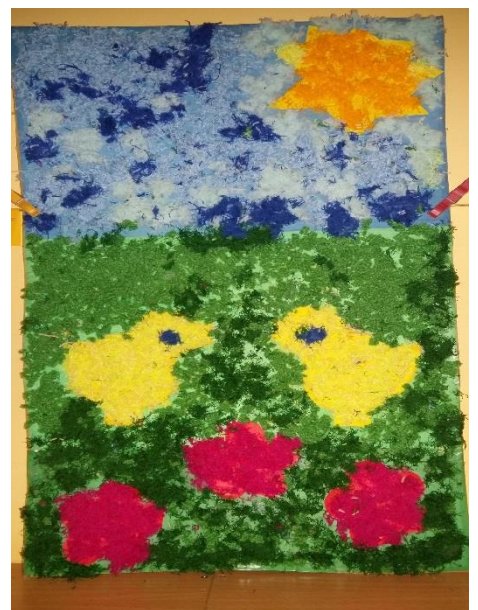
Valmis töö, sõimerühm (2017, H.Valdmann)