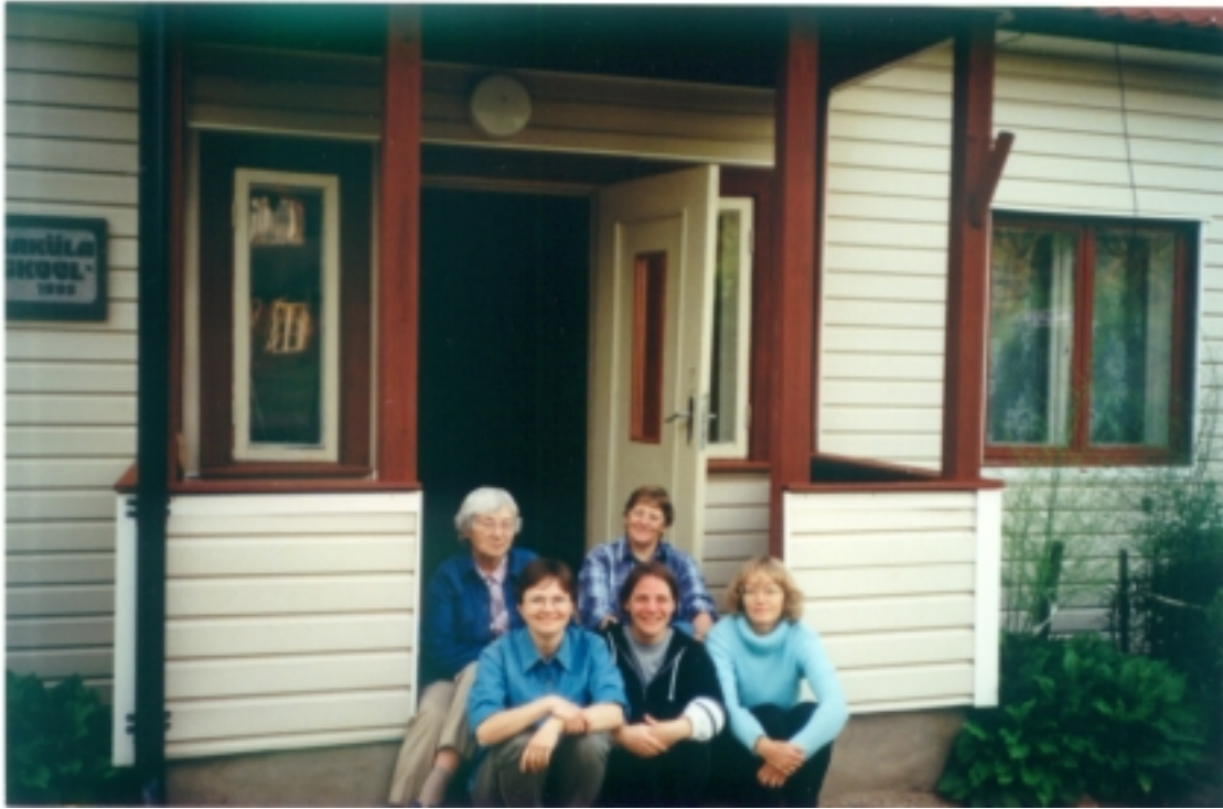
Pilt samblasõpradest Kanaküla koolimaja trepil

Kanaküla ürgmetsa sammalde nimestik (koostanud Nele Ingerpuu, Leiti Kannukene, Mari Tobias ja Loore Ehrlich). Sammalde ladinakeelsete nimede aluseks on: Ingerpuu, N., Kalda, A., Kannukene, L., Krall, H., Leis, M., Vellak, K. 1994. Eesti sammalde nimestik. – Abiks Loodusevaatlejale, nr. 94, lk. 1-175.