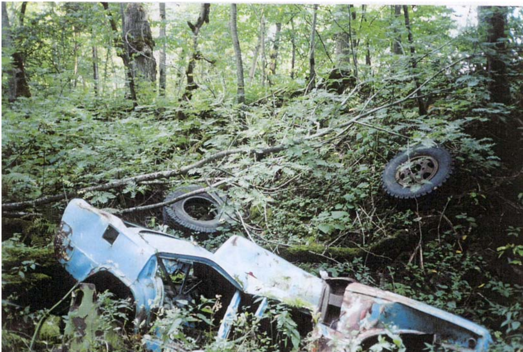
Pilt autovrakist Ontika paekalda alusel.

Tahaks loota, et selle projekti tulemusena õnnestub ka üldsusele teadvustada klindi koosluste unikaalsust ja aidata kaasa nende puhtana säilitamisele.