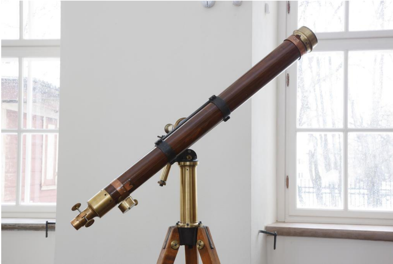
Väike Fraunhoferi läätsoteleskoop, Ed. Hoeppneri kingitus.