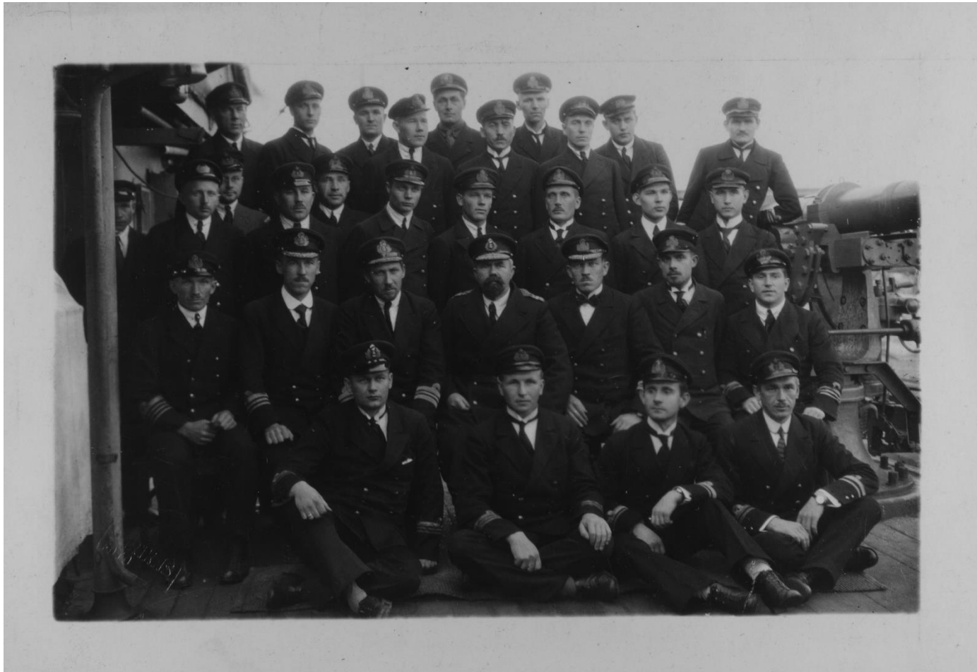
Grupp Eesti mereväe ohvitseride 1919 EFA 3-P-0-52195