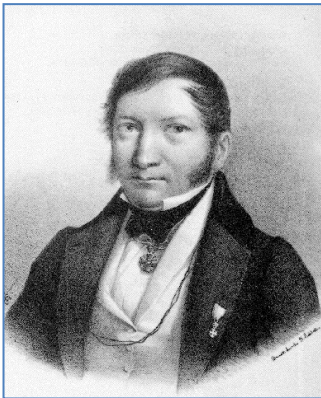
Friedrich Georg Wilhelm von Struve (1793–1864)