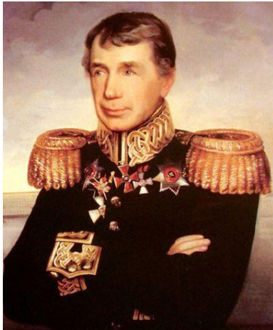
Adam Johann von Krusenstern (1770–1846)