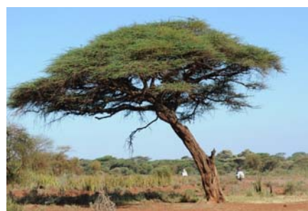
Ül. 7 Pilt 3